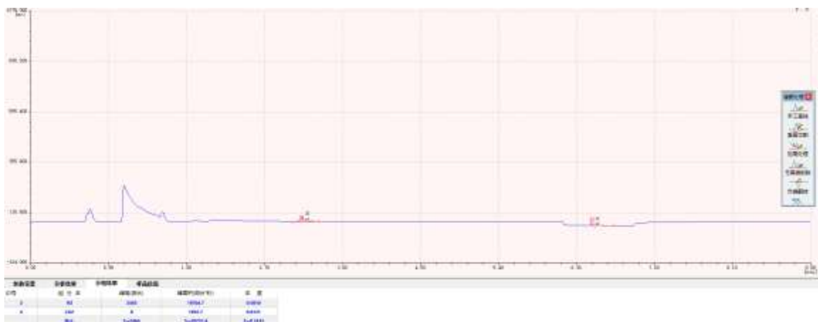
图2 15%氩/氢混合气色谱分离图

通过实验证明，色谱柱分离温度在55℃恒温时，15%氩/氢混合气中氮气、甲烷、一氧化碳和二氧化碳各组分分离效果良好，分离度R均大于2，能够满足测定要求。